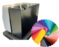
Peinture Epoxy blanche ou carrosserie aluminium de base. RAL aux choix (option).