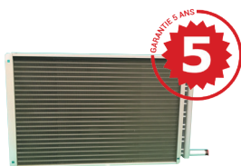
Échangeur à ailettes en aluminium. Traitement epoxy ou aluminium.