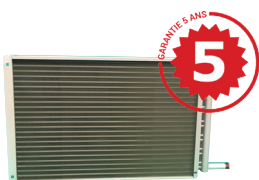
Échangeur à ailettes en aluminium. Traitement epoxy ou aluminium.