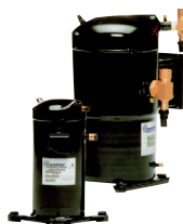
Compresseur scroll à partir du 4. Compresseur rotatif (taille 2 et 3).