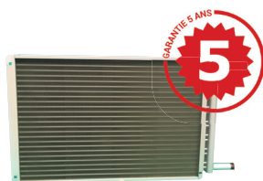
Echangeur à ailettes en aluminium. Traitement epoxy ou aluminium.