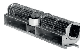
Ventilateur à vitesse variable.